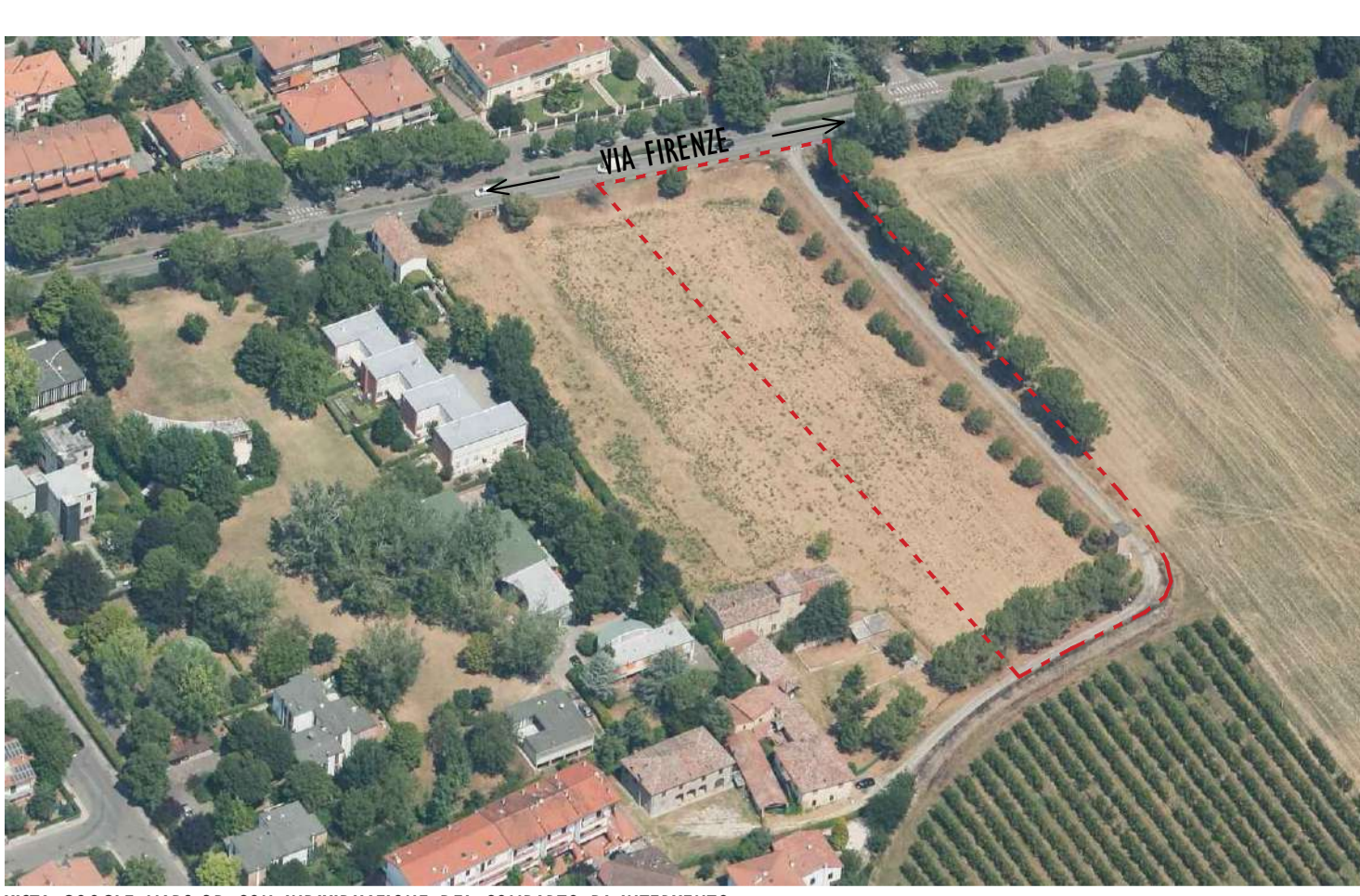
VISTA GOOGLE MAPS 3D CON INDIVIDUAZIONE DEL COMPARTO DI INTERVENTO